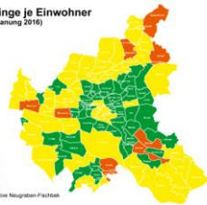
Neugraben-Fischbek Mittel zur Planung bis zum 2016 Verordnung der Bürgerinitiative Neugraben-Fischbek